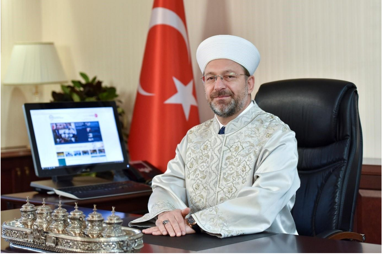
Prof. Dr. Ali ERBAŐ Diyanet İşleri Başkanı